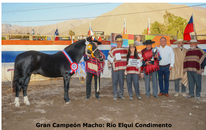
Gran Campeón Macho: Río Elqui Condimento