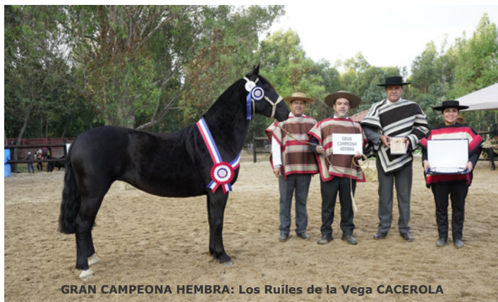
GRAN CAMPEONA HEMBRA: Los Ruiles de la Vega CACEROLA