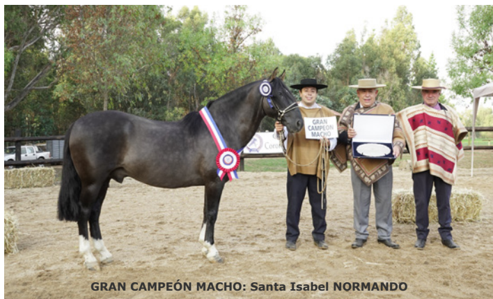
GRAN CAMPEÓN MACHO: Santa Isabel NORMANDO