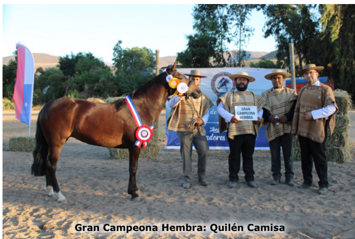
Gran Campeona Hembra: Quilén Camisa