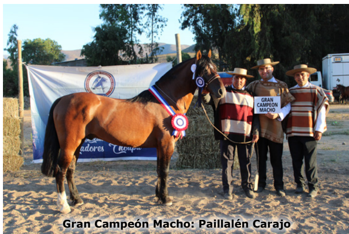
Gran Campeón Macho: Paillalén Carajo

"Fue un evento no exento, como todos, de varios temitas de último momento. Teníamos organizada nuestra exposición en otra sede, por motivos de fuerza mayor tuvimos que cambiarla aquí a Illapel, pero creo que nos salió bastante