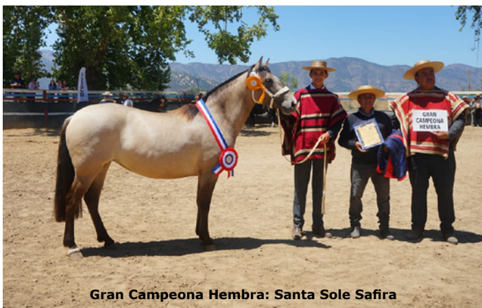
Gran Campeona Hembra: Santa Sole Safira