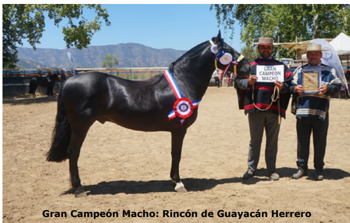
Gran Campeón Macho: Rincón de Guayacán Herrero